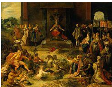
Allegorie op de troonsafstand van Karel V. Schilderij door Frans Francken II uit 1620.

Karel V zag de Godsdienstvrede van Augsburg als een persoonlijke nederlaag. Teleurgesteld en uitgeput door het vrijwel permanente rondreizen, deed hij op 25 oktober 1555 in Brussel troonsafstand. Dit was een voor die tijd zeer ongewone en opzienbarende daad. Voor deze plechtigheid in de Aula Magna van het Paleis op de Koudenberg waren vertegenwoordigers van alle Zeventien Provinciën, leden van de regeringsorganen en de ridders van het Gulden Vlies bijeengekomen.