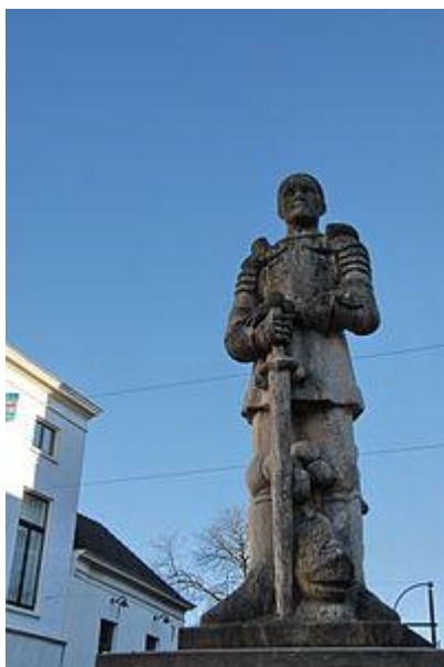
Standbeeld van Karel van Egmont van Gelre in Arnhem.

Karel van Gelre (Grave, 9 november 1467 – Arnhem, 30 juni 1538), ook wel Karel van Egmont genoemd, was hertog van Gelre en graaf van Zutphen uit het huis Egmont.