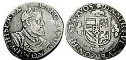
Voor- en achterzijde van een zilveren Carolusgulden

Gelre, het Neder- en Oversticht en Groningen werden bij het Verdrag of de Transactie van Augsburg van 26 juni 1548 uit de Westfaalse kreits losgemaakt en bij de Bourgondische Kreits gevoegd, waartoe de andere Bourgondische erflanden van Karel V behoorden.