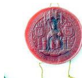
Het grootzegel van Karel V

Mede door deze vergroting van het Nederlandse grondgebied, maar ook door die van de internationale contacten binnen het wereldrijk van Karel V, groeide de economie van de Nederlanden in snel tempo. De bloeiende handel leidde tot de opkomst van een commerciële geldmarkt, waarop met name de zogeheten Lombarden actief waren[14]. Op monetair vlak voerde Karel V in 1521 een gulden van 20 stuivers in, zowel als rekeneenheid als in de vorm van een gouden munt, die al gauw de Carolusgulden werd genoemd. In 1543 kwam er ook een zilveren Carolusgulden.