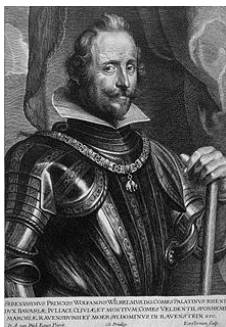
Wolfgang Wilhelm von Pfalz-Neuburg, kleinzoon van Willem V, gravure van Lucas Vorsterman naar een portret van Anthony van Dyck.