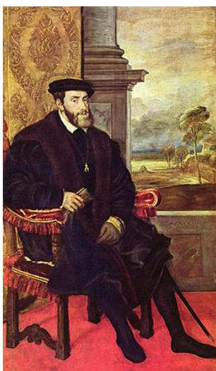
Karel V in Augsburg. Schilderij door Titiaan uit 1548 .

Keizer Karel V (Gent, 24 februari 1500 – Cuacos de Yuste (Spanje), 21 september 1558), voor zijn mondigverklaring Karel van Luxemburg geheten, uit het Huis Habsburg, was sinds 1506 landsheer van uiteindelijk (1543) alle Nederlandse gewesten, van 1516 tot 1556 als Karel I koning van Spanje en van 1519 tot 1556 als Karel V Rooms-Duits keizer. In België staat hij algemeen bekend als Keizer Karel, in Nederland als Karel V.