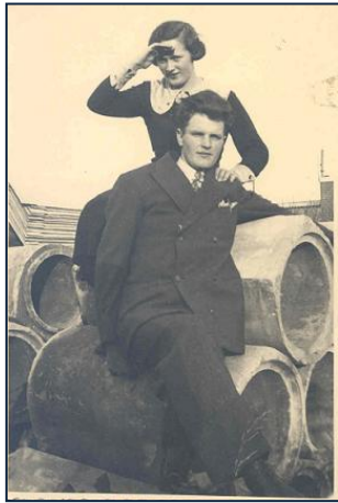
Boxmeer, Beugenseweg 5