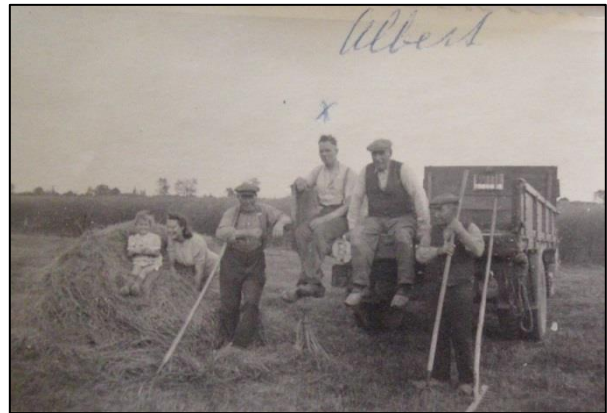
Met zijn vrachtwagen.