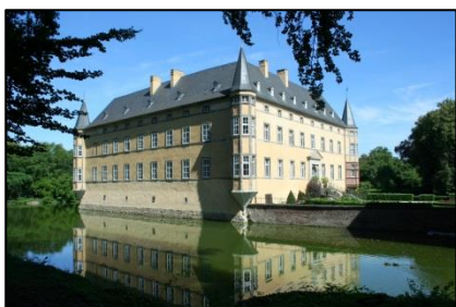
Burg Adendorf, ab 1815 bis heute in Familienbesitz von Loë.