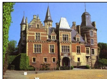
Kasteel van Mheer, Limburg Nederlande, seit 1668 im Besitz derer von Loë.