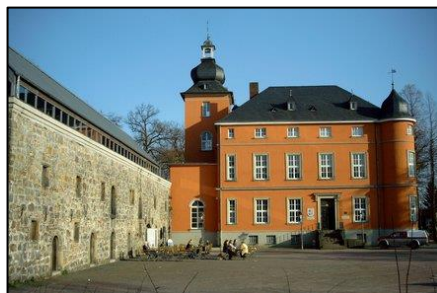
Burg Wissem, 1833–1939 im Besitz der Familie von Loë.