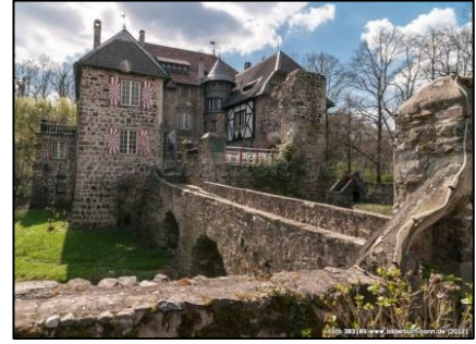
Burg Lede, seit 1987 bis heute im Besitz der Freiherren von Loë.